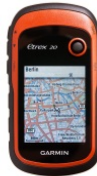
Handeltübliches GPS-Gerät.

Ein Multicache ist eine Variante des Geocachens. Es funktioniert wie eine Schnitzeljagd. An einem bekannten Startpunkt erhalten die Teilnehmenden einen Hinweis auf den ersten Cache. Meist ist dazu ein kleines Rätsel zu lösen. Der folgende Cache enthält dann wieder einen Hinweis auf den nächsten Cache und so weiter. Am Schluss steht dann der „Final“ genannte Schatz.