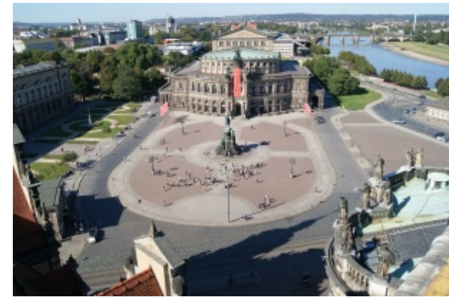
Der Theaterplatz. Auch hier ist ein Cache versteckt...

Nein. Ohne die Hinweise wird es schwer, die Caches zu entdecken. Trotzdem: Wer nach einem Cache sucht, sollte sich unauffällig, wie in einem Spionagefilm verhalten, damit Uneingeweihte („Muggles“) nicht mitbekommen, wo sich ein Cache verbirgt.