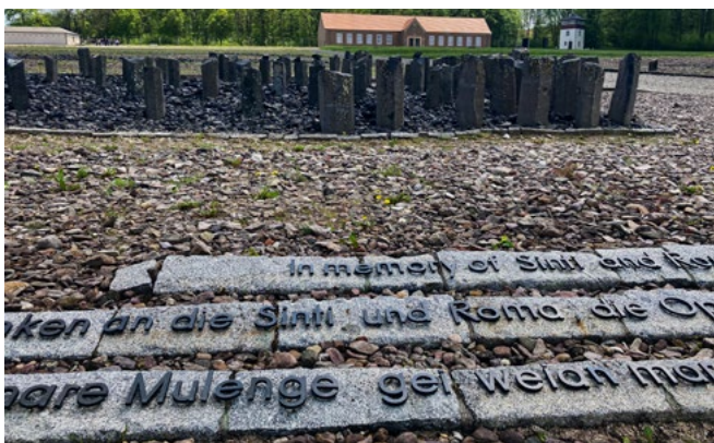
Denkmal für die in Buchenwald ermordeten Sinti und Roma.

Das Herbert-Wehner-Bildungswerk mit Sitz in Dresden ist ein staatlich geförderter Verein, der seit 1992 politische Erwachsenenbildung anbietet. Ziel der Arbeit ist, mit Diskussionsveranstaltungen, Bildungsfahrten und Seminaren das demokratische Verständnis zu stärken.